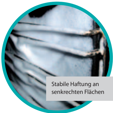
Stabile Haftung an senkrechten Flächen