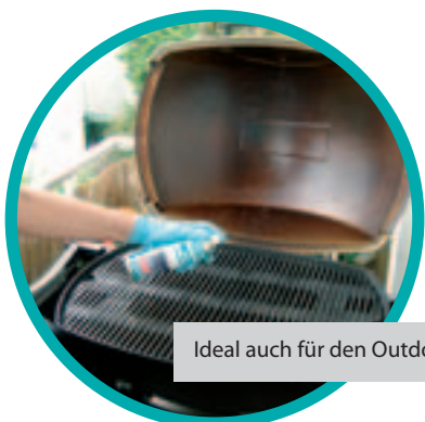
Ideal auch für den Outdoor-Grill